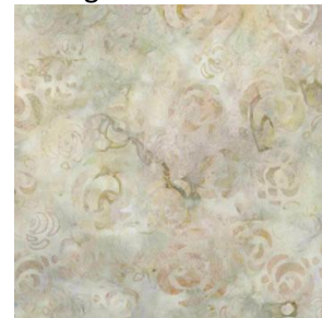
{14-rk - Blomster Sand} fra R. Kaufman.

Det vil passe bra med slike farger på stoffene: